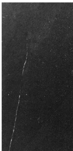
◀ Fini mat Épaisseur nominale : 9 mm 30 x 60 cm (12" x 24") HV.RS.BLK.1224.MT 60 x 60 cm (24" x 24") HV.RS.BLK.2424.MT 60 x 120 cm (24" x 48") HV.RS.BLK.2448.MT