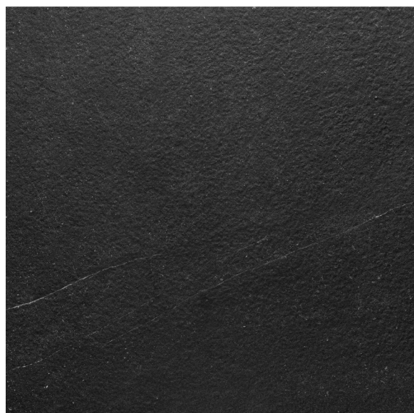
Fini structuré 60 x 60 cm (24" x 24") HV.RS.BLK.2424.ST ▶

Tous les items présentés dans ce document font partie du programme d'inventaire Olympia. Pour les commandes spéciales, veuillez contacter votre représentant de Tuiles Olympia.