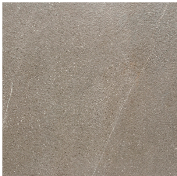
Fini structuré 60 x 60 cm (24" x 24") HV.RS.MKA.2424.ST