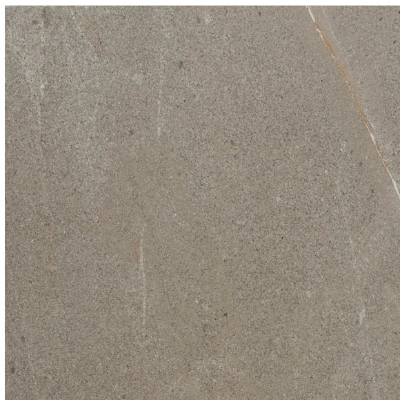
Fini mat Épaisseur nominale : 9 mm 60 x 60 cm (24" x 24") HV.RS.MKA.2424.MT